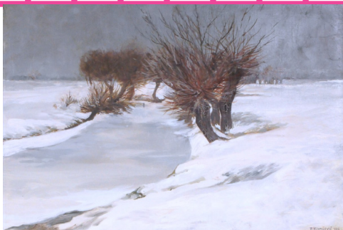
Krivotvorina slike Ferde Kovačevića „Vrbe na Savi“, MP 2453.

Ulje na platnu, dimenzija 82 x 61 cm, opremljeno okvirom. Slika je izazvala sumnju u autentičnost s obzirom na način slikanja, potpis i dataciju. Za usporedbu i dokazivanje kopije korištena je jedna autorova slika posuđena iz Moderne galerije. Slikarski rukopis i postupak nisu odgovarali radu Ferde Kovačevića. Slika je izrađena rjeđom bojom uz obilnije korištenje sikativa, razlika je bilo i u crtačkom pristupu u pojedinostima i koloritu te korištenju prostornih i kolorističkih elemenata kojima se gradi kompozicija i prostornost slike. Fizikalna analiza (XRF) pokazala je da se pri slikanju sporne slike koristila mješavina titan-cink bijele boje, a to se nije slagalo s onim što je Kovačević koristio. Slika je oslikana na platnu sličnog broja niti kao izvorni rad, ali se dokazalo kako je uporabljeno ostarjelo, već korišteno platno, koje se po načinu proizvodnje razlikuje od platna izvorne slike. Potpis je popravljan kako bi se približio izvorniku, ali je ostao trag izbrisane boje. Snimanje UV fluorescencijom pokazalo je različitost u zoni potpisa, što je vjerovatno posljedica prijenosa laka s tragovima pigmenta obrisane prve inačice potpisa.