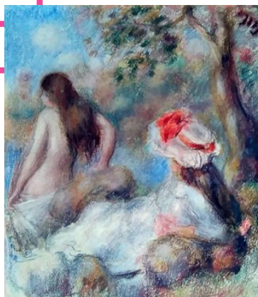
Krivotvorina slike Pierre-Auguste Renoira „Kupanje“, MP 2721.

Ulje na platnu, dimenzija 82 x 61 cm, opremljeno okvirom. Slika je izazvala sumnju u autentičnost s obzirom na način slikanja, potpis i dataciju. Za usporedbu i dokazivanje kopije korištena je jedna autorova slika posuđena iz Moderne galerije. Slikarski rukopis i postupak nisu odgovarali radu Ferde Kovačevića. Slika je izrađena rjeđom bojom uz obilnije korištenje sikativa, razlika je bilo i u crtačkom pristupu u pojedinostima i koloritu te korištenju prostornih i kolorističkih elemenata kojima se gradi kompozicija i prostornost slike. Fizikalna analiza (XRF) pokazala je da se pri slikanju sporne slike koristila mješavina titan-cink bijele boje, a to se nije slagalo s onim što je Kovačević koristio. Slika je oslikana na platnu sličnog broja niti kao izvorni rad, ali se dokazalo kako je uporabljeno ostarjelo, već korišteno platno, koje se po načinu proizvodnje razlikuje od platna izvorne slike. Potpis je popravljan kako bi se približio izvorniku, ali je ostao trag izbrisane boje. Snimanje UV fluorescencijom pokazalo je različitost u zoni potpisa, što je vjerovatno posljedica prijenosa laka s tragovima pigmenta obrisane prve inačice potpisa.